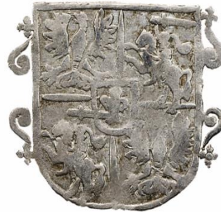
Liczba rewersów: 2