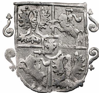
Liczba rewersów: 4