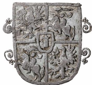
Wariant 10d Średnie