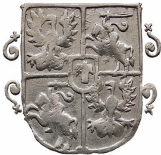
Liczba rewersów: 59