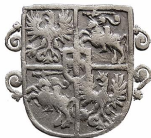
Wariant 10c Małe