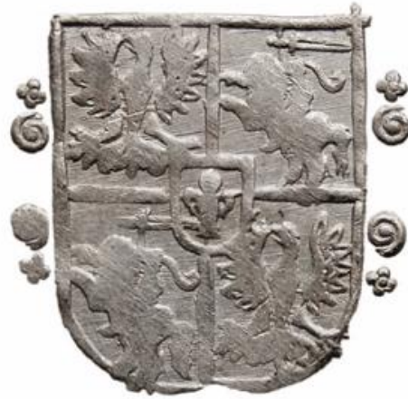
Liczba rewersów: 20