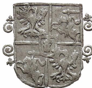
Wariant 10e Duże, spirala nie podzielona