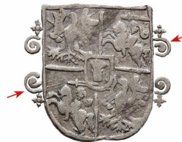
Wariant 10f Duże, jądro spirali oddzielone