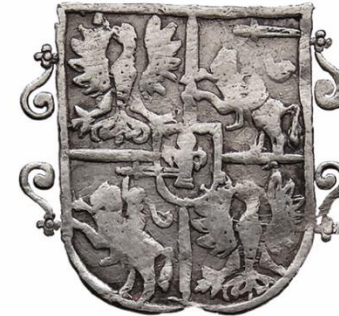
Liczba rewersów: 5