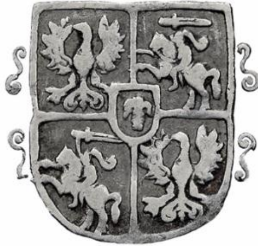
Liczba rewersów: 1