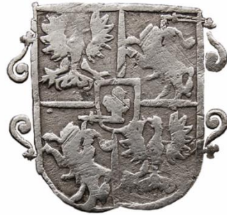
Liczba rewersów: 3